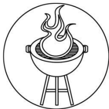
Auf einem Grill