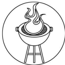
Auf einem Grill